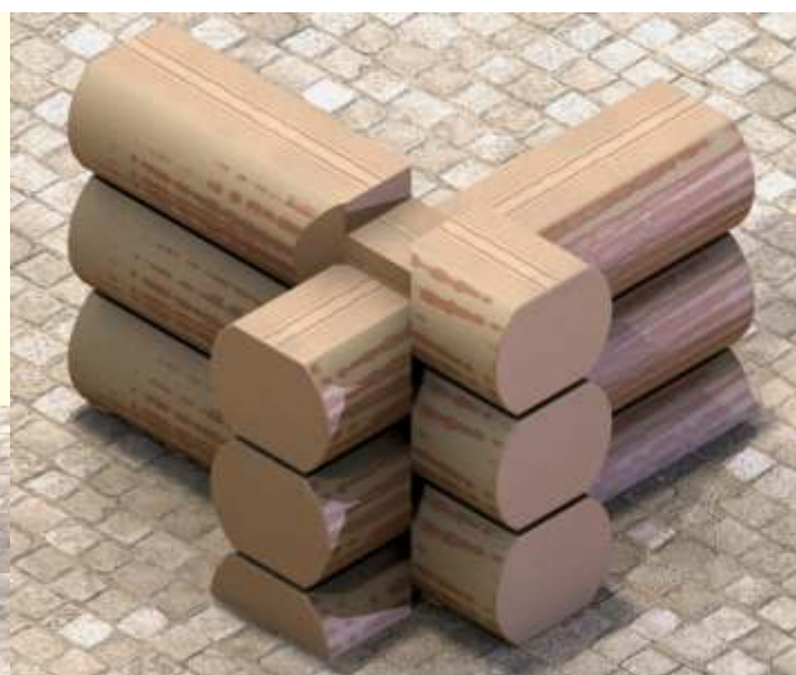
Narozcięte ciany wewnętrzne zacięciem w głównym kierunku z resztkami.

Domy z bali w technologii okorowanych ze ściętymi poziomymi powierzchniami podstaw.